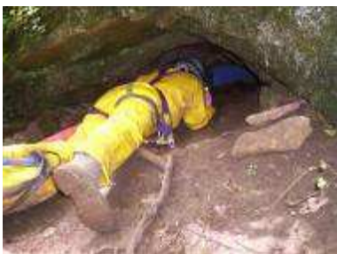
Entrée de la grotte du Crochet

La marche d'approche pour accéder à la grotte se fera en 10 min.